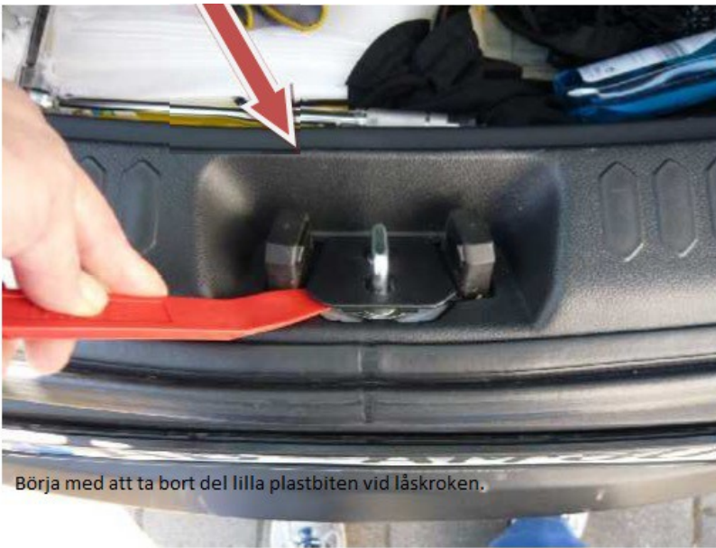
Börja med att ta bort del lilla plastbiten vid låskroken.