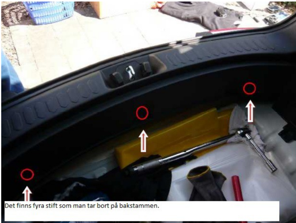
Det finns fyra stift som man tar bort på bakstammen.